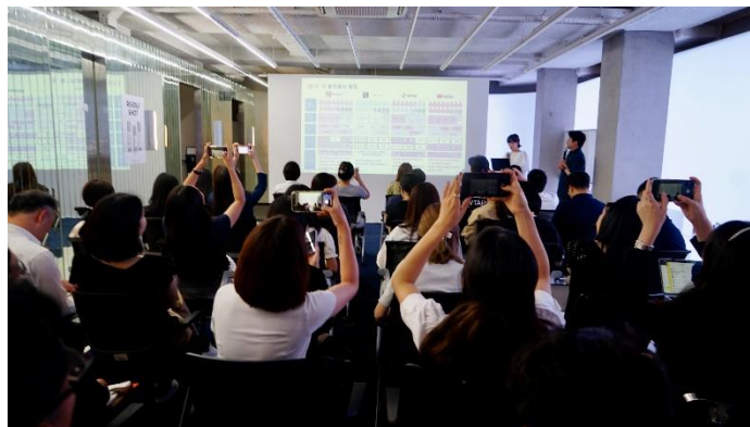
韓国ソウルでの現地ブランドに向けたセミナーの様子

本取り組みについては、既に複数のブランドにおいて実施が決定しており、8 月 8 日には韓国ソウルにて韓国コスメブランド向けの共同セミナーを開催いたしました。